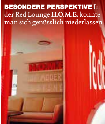
BESONDERE PERSPEKTIVE In der Red Lounge H.O.M.E. konnte man sich genüsslich niederlassen