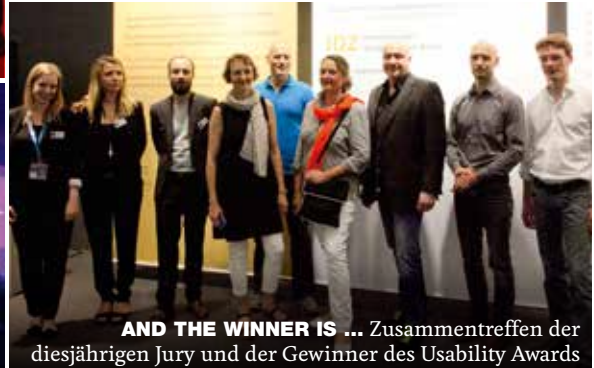
AND THE WINNER IS ... Zusammentreffen der diesjährigen Jury und der Gewinner des Usability Awards