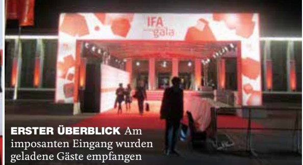
ERSTER ÜBERBLICK Am imposanten Eingang wurden geladene Gäste empfangen