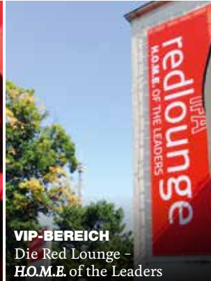
VIP-BEREICH Die Red Lounge – H.O.M.E. of the Leaders