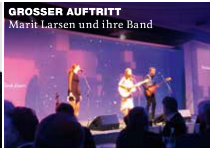
GROSSER AUFTRIIT Marit Larsen und ihre Band