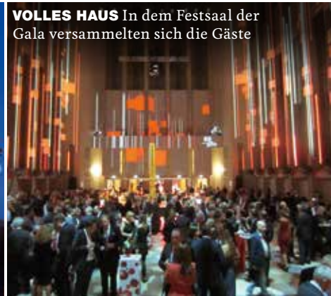
VOLLES HAUS In dem Festsaal der Gala versammelten sich die Gäste