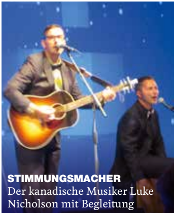
STIMUNGSMACHER Der kanadische Musiker Luke Nicholson mit Begleitung