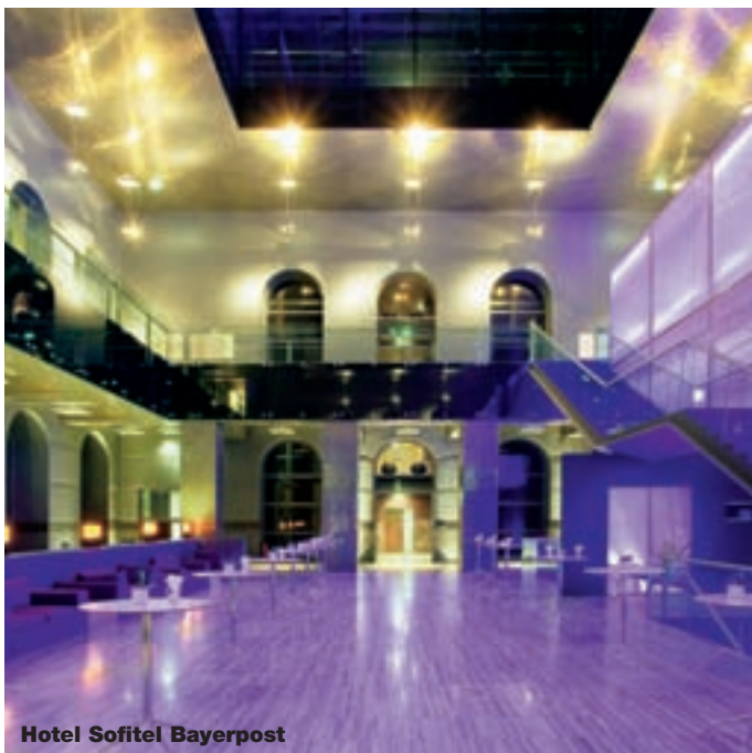
Hotel Sofitel Bayerpost

Kunstverein München e.V., Galeriestraße 4, Tel.: 221152, www.kunstverein-muenchen.de