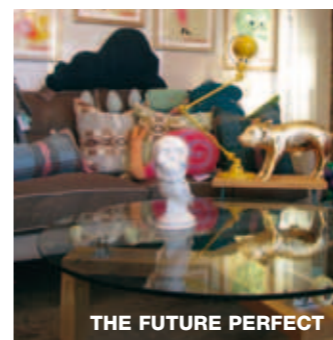
THE FUTURE PERFECT

POWERHOUSE BOOKS Die Foto- und Kunstbücher des unabhängigen Verlags PowerHouse Books zählen seit Gründung des Unternehmens 1995 zu den interessantesten, die der US-Markt zu bieten hat. In dem riesigen Laden unter dem Verlagsbüro, der PowerHouse Arena, kann man stundenlang stöbern, Geld ausgeben, Kunst anschauen und Lesungen lauschen. 37 Main Street, Tel.: +1 718 6663049, www.powerhousearena.com