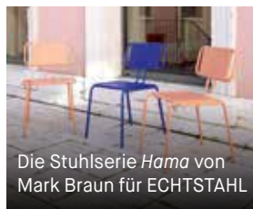
Die Stuhlserie Hama von Mark Braun für ECHTSTAHL