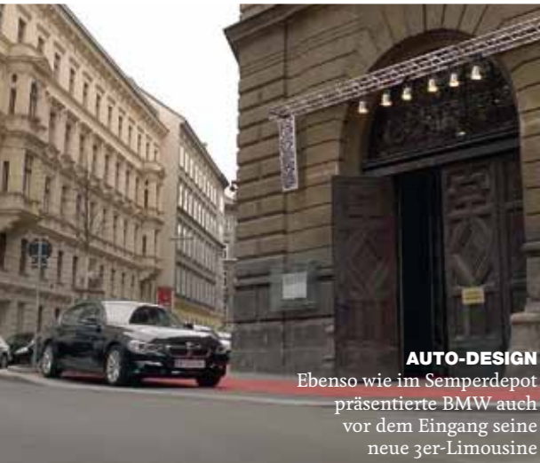
AUTO-DESIGN Ebenso wie im Semperdepot präsentierte BMW auch vor dem Eingang seine neue 3er-Limousine