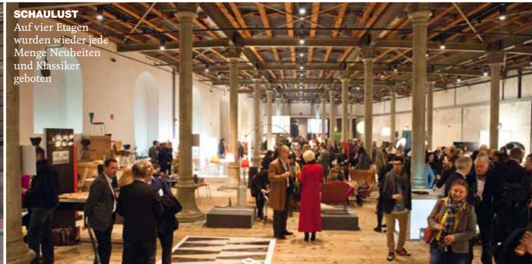
SCHAULUST Auf vier Etagen wurden wieder jede Menge Neuheiten und Klassiker geboten