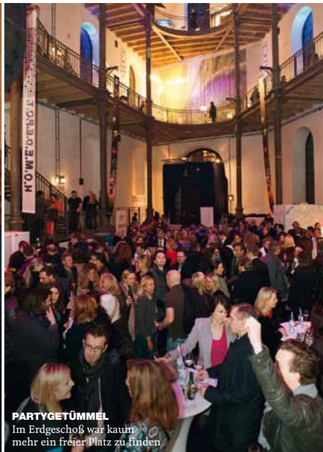
PARTYGETÜMMEL Im Erdgeschoß war kaum mehr ein freier Platz zu finden