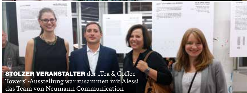
STOLZER VERANSTALTER der „Tea & Coffee Towers“-Ausstellung war zusammen mit Alessi das Team von Neumann Communication