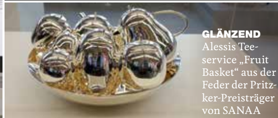
GLÄNZEND Alessi Tee-service „Fruit Basket“ aus der Feder der Pritzker-Preisträger von SANAA