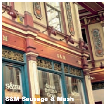
S&M Sausage & Mash