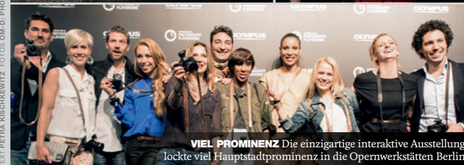
VIEL PROMINENZ Die einzigartige interaktive Ausstellung lockte viel Hauptstadtprägnanz in die Opernwerkstätten Berlin