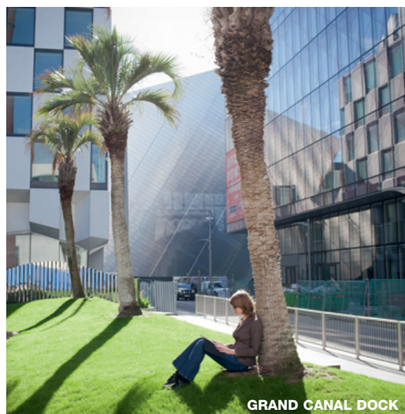
GRAND CANAL DOCK