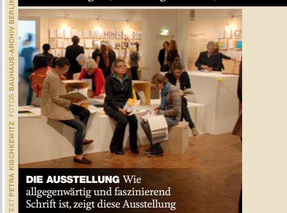
DIE AUSSTELLUNG Wie allgegenwärtig und faszinierend Schrift ist, zeigt diese Ausstellung