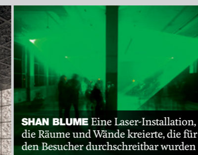
SHAN BLUME Eine Laser-Installation, die Räume und Wände kreierte, die für den Besucher durchschreitbar wurden