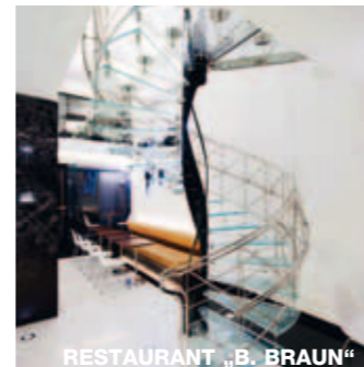
RESTAURANT „B. BRAUN“

CAFE-CAFE Bei Promis und Modelleuten sehr beliebt. Vielleicht liegt es an dem weltbesten Himbeerkäsekuchen. Der Service ist hervorragend. Rytířská 10, Prag 1, www.cafecafe.cz