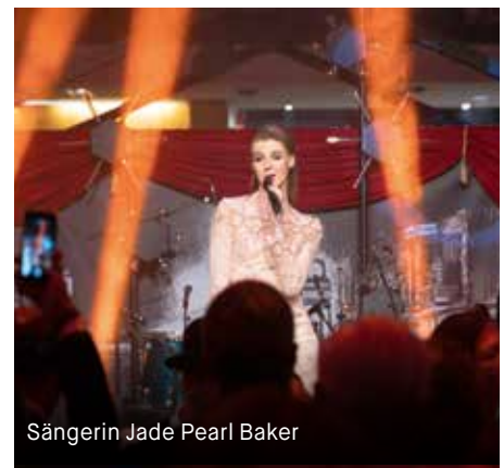
Sängerin Jade Pearl Baker