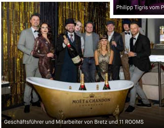
Geschäftsführer und Mitarbeiter von Bretz und 11 ROOMS