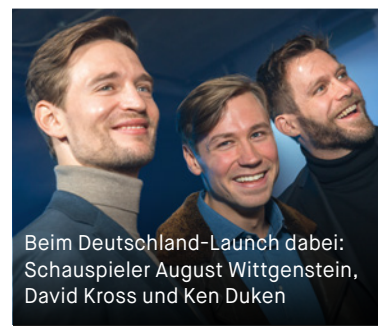
Beim Deutschland-Launch dabei: Schauspieler August Wittgenstein, David Kross und Ken Duken