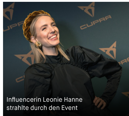
Influencerin Leonie Hanne strahlte durch den Event