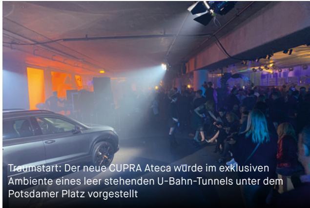
Traumstart: Der neue CUPRA Ateca würde im exklusiven Ambiente eines leer stehenden U-Bahn-Tunnels unter dem Potsdamer Platz vorgestellt

Zum Deutschlandstart des neuen CUPRA Ateca feierte H.O.M.E. zusammen mit Schauspielern, Musikern und weiteren Prominenten exklusiv in Berlin. Die Stimmung des Abends beweist: Sportlichkeit, Sophistication und Design des charakterstarken SUVs treffen den Zeitgeist der illustren Gäste