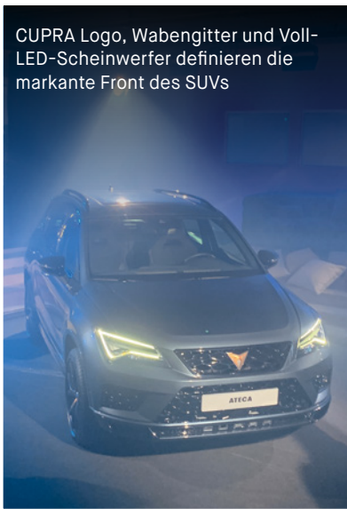
CUPRA Logo, Wabengitter und Voll-LED-Scheinwerfer definieren die markante Front des SUVs