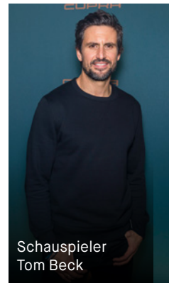
Schauspieler Tom Beck

KRAFTSTOFFVERBRAUCH CUPRA ATECA, INNERORTS: 8,9 L/100 KM, AUSSERORTS: 6,3 L/100 KM, KOMBINIERT: 7,3 L/100 KM; CO 2 -EMISSION, INNERORTS: 202 G/KM, AUSSERORTS: 143 G/KM, KOMBINIERT: 165 G/KM; CO 2 -EFFIZIENZKLASSE: D