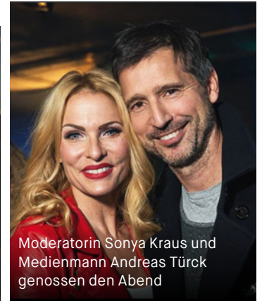
Moderatorin Sonya Kraus und Medienmann Andreas Türck genossen den Abend