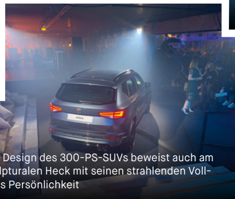
Das Design des 300-PS-SUVs beweist auch am skulpturalen Heck mit seinen strahlenden Voll-LEDs Persönlichkeit