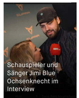
Schauspieler und Sänger Jimi Blue Ochsenknecht im Interview