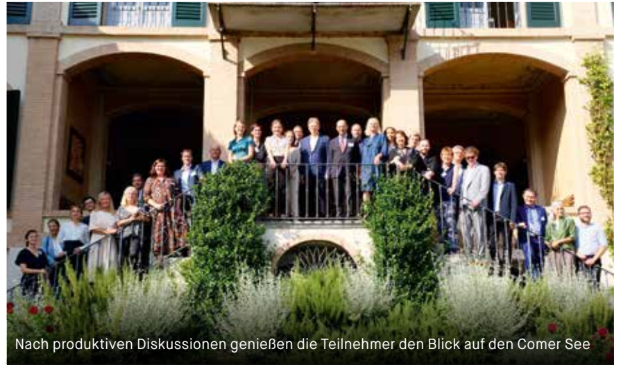
Nach produktiven Diskussionen genießen die Teilnehmer den Blick auf den Comer See