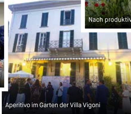
Aperitivo im Garten der Villa Vigoni