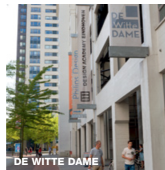
DE WITTE DAME

DUTCH DESIGN YEAR Die Dutch Design Week zeigt eine Woche lang Entwürfe der Designer und Künstler der Stadt. In diesem Shop sind viele ihrer Designs das ganze Jahr über zu kaufen. Das Schnuppern im Sortiment macht ungeheuren Spaß. Smalle Haven 4, Tel. +31 614 100376, www.dutchdesignyear.com